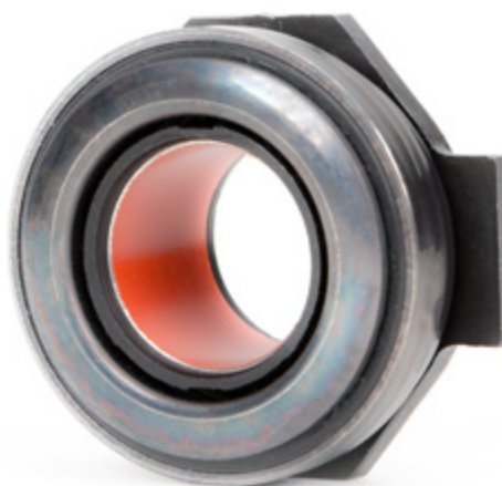
Fig. 3: Os rolamentos de desengate com casquilho de PTFE não devem ser lubrificados com lubrificante