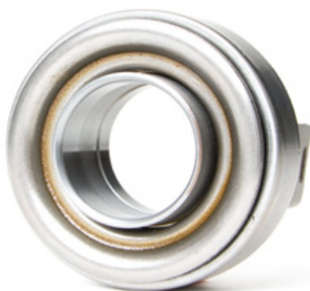
Fig. 1: Os rolamentos de desengate com casquilho de metal devem ser lubrificados com lubrificante

Observar as indicações do fabricante do veículo.