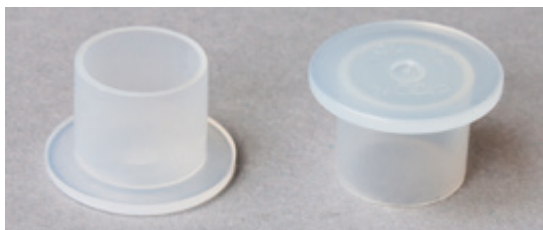
Fig. 2: Tampa de pré-selagem velocidades (2)

Na desmontagem da caixa de velocidades, o dispositivo de ventilação da mecatrónica deve manter-se estanque.