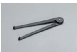
Imagem 3: 400 0238 10

Tanto o estojo de ferramentas como as ferramentas soltas incluídas no novo estojo devem ser adquiridas através do seu distribuidor habitual de produtos LuK.