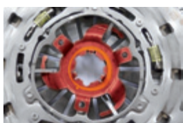
Imagem 4: Peça de bloqueio