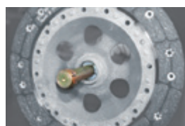
Imagem 6: 400 0111 10 em uso