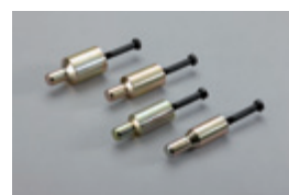
Imagem 7: 400 0069 10 400 0045 10 (novo) 400 0110 10 400 0046 10