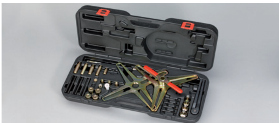
Imagem 2: 400 0237 10 - O novo estojo com conteúdo ampliado

Para a substituição de uma embraiagem auto-ajustável, utilize uma ferramenta especial. O estojo com a referência 400 0237 permite efectuar todas as operações de reparação. As ferramentas adicionais, para completar o conteúdo do anterior estojo, podem ser obtidas em separado.