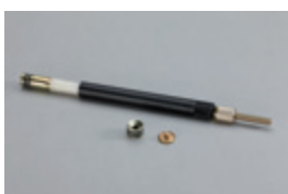
Imagem 5: 400 0111 10