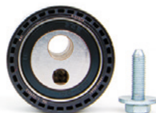
Fig. 3: 531 0264 10 - Polia tensora com o parafuso fornecido

Se o parafuso de bucha estiver solto, deve-se voltar a apertar ao binário especificado com uma ferramenta adequada.