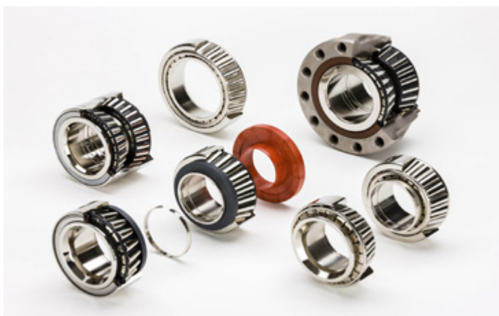
Figura 1: Programa de produtos FAG para veículos comerciais

Há já vários anos que a FAG disponibiliza soluções inovadoras de manutenção para rolamentos de roda. Com elas é possível oferecer ao cliente uma solução de manutenção de primeira qualidade e, ao mesmo tempo, económica.